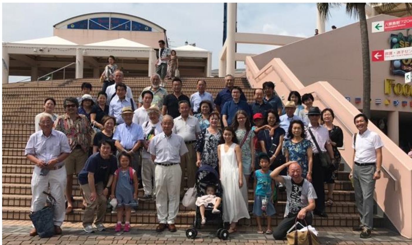
横浜「八景島シーパラダイス」

小田原駅西口—《小田原厚木道路》—《東名》—海老名 SA—横浜町田 IC—《横須賀横浜道路》10:45 配車 11:00 出発 11:40-11:55—並木 IC—横浜・八景島シーパラダイス—並木 IC—新横浜 IC—新横浜プリンスホテル 13:00 到着 16:30 出発 18:00 到着 20:30 出発 横浜青葉 IC—《東名高速道路》—厚木 IC—《小田原厚木道路》—小田原駅西口 21:40 到着・解散